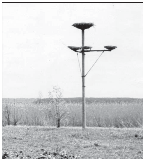
Фото 2. Группа искусственных гнездовий на специально установленном бетонном столбе. Киевская обл., Переяслав-Хмельницкий р-н, с. Козлов. 1986 г.